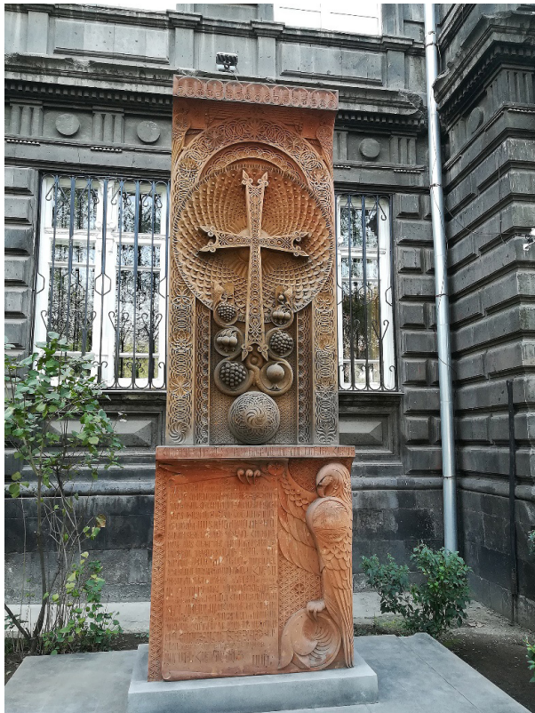
Ил. 1. Ереван. Хачкар перед зданием богословского факультета.

логии 1 сентября 1995 г., иными словами, он маркирует и акцентирует «начало» истории факультета и имя основателя. Сам факт установки хачкара является знаком благодарности будущих поколений студентов основателю факультета.