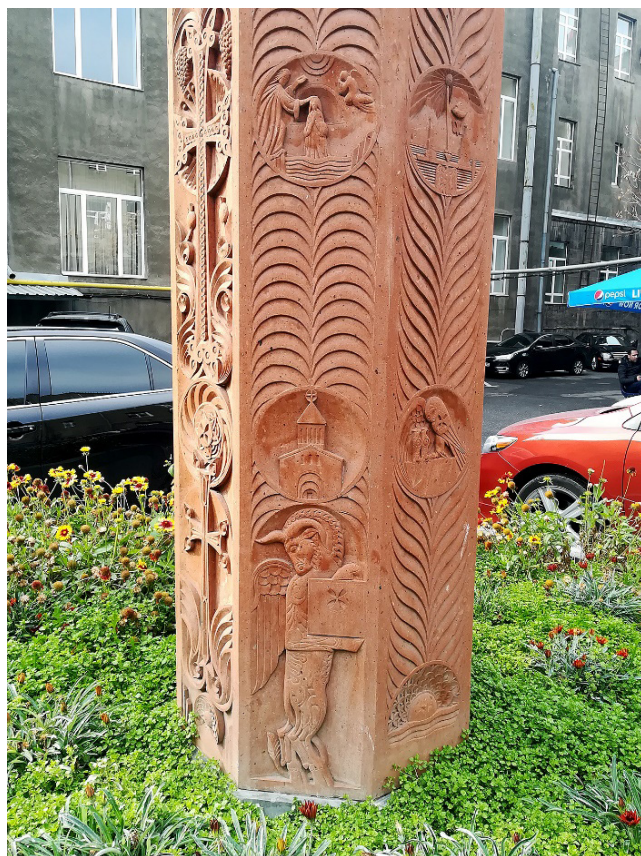
Ил. 5. Основание посоха-креста. 2019.

Внешне татевский и университетский посохи похожи, особенно сходны форма верхней части и постамент-восьмигранник, на котором и возвышается посох-крест. Насчёт восьмигранника можно высказать два предположения. Во-первых, восьмигранник связан с числом «восемь», означающим бесконечность. Отсюда можно вывести, что крест вырастает из восьмигранника как из «вечной основы». Если первая интерпретация – теологическая, то вторая имеет утилитарное значение, а именно, во-вторых, в восьмиграннике с весны растут цветы, что придаёт бетонно-каменному университетскому пространству цвет . Здесь разводятся разноцветные растения (кареопторис, гайлардия и т. д.) и создаётся ощущение, что вместе с ними в оазисе бетонного «ландшафта» возвышается и расцветший посох-крест (ил. 5).