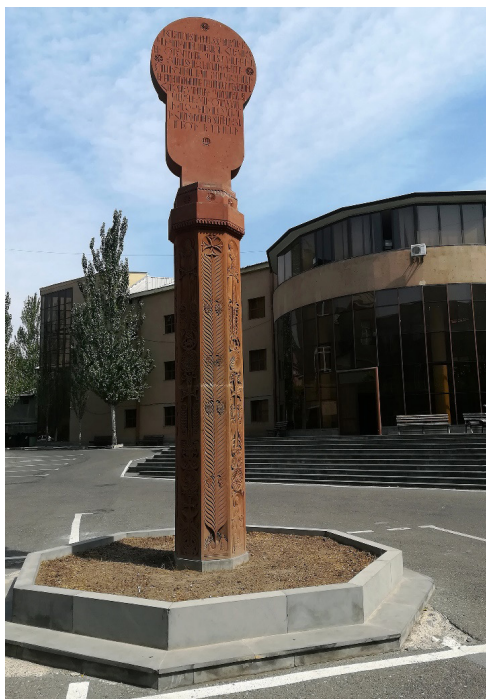
Ил. 3. Ереван. Посох-крест во дворе богословского факультета. Фото автора, 2018.

В 2015 г. интересный монумент был воздвигнут между шестым и восьмым корпусами ЕГУ (Абовяна, 52 и Абовяна, 52 а). В память 100-летия геноцида армян был поставлен расцветший посох-крест – при патриаршестве Гарегина II, католикоса всех армян, по инициативе епископа Анушавана Жамкочяна и благодаря финансированию патриота мецената-благотворителя Грачья Мисабовича Погосяна (ил. 3).