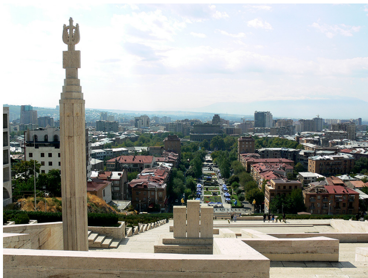
Ил. 7. Ереван. Каскад. Фото: Сергей Аванесов, 2019.

со зданием семинарии. Заметим, что, наличие архимандритских посохов в интерьере армянских церквей является нововведением, имеющим, видимо, дидактический характер. Поскольку основные службы с участием семинаристов проводятся в этой церкви, то здесь активизируется прагматическое назначение названного символа: перед глазами студентов находится визуальная аллегория спасения и мудрости, если интерпретировать это изображение в контексте христианства. Если же посмотреть на него с точки зрения мифопоэтики, мы увидим, что в алтаре выражен архетип Древа Жизни.