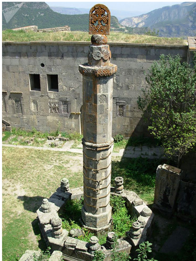
Ил. 4. Татев. Гавазан.