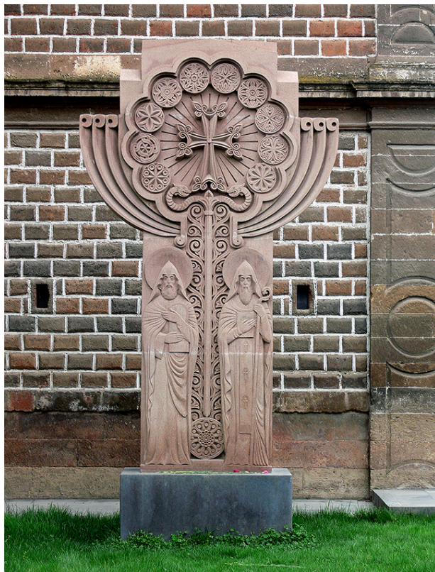
Ил. 6. Эчмиадзин. Посох-крест. Фото: Сергей Аванесов, 2019.

Последующие примеры возведения посоха-креста показывают, что эти сооружения начали появляться при высших учебных заведениях в знак продолжения средневековой университетской традиции. Одним из примеров является посох-крест, недавно установленный рядом со зданием семинарии Св. Эчмиадзина (ил. 6). На сооружении мы видим архимандритский посох с драконами-змеями, а в центре – расцветший крест. Важно, что на данном сооружении представлены фигуры создателей письменного цивилизационного кода – Месропа Маштоца и Саака Партева; памятник им же установлен и перед зданием главного корпуса ЕГУ. Этим изображением акцентируется значимость важнейшего события в культурной истории Армении – возникновения письменности как цивилизационного кода армян, что послужило предпосылкой развития и расцвета духовной литературы (агиографии, истории, патристики, теологии, философии и т. д.).