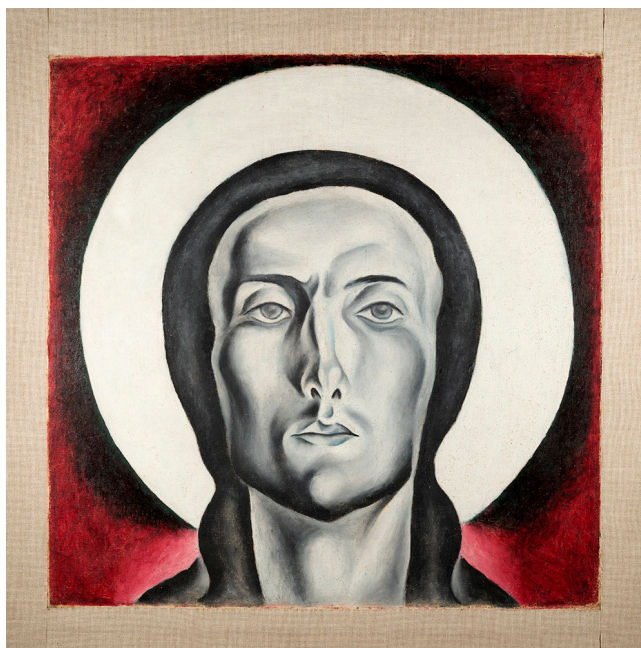
Ил. 4. С. В. Воинов. Голова Спасителя. 1919. Х., м.