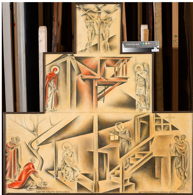
Ил. 5. С. В. Воинов. Грехопадение. Благовещение. Рождество Христово. 1918. Х., м.

Триптих «Грехопадение. Благовещение. Рождество Христово» (1918), полотно «Голова Спасителя» (1919) (ил. 4) и незаконченный холст «Чудеса исцеления о край одежды и воскрешение дочери Иаира» (1920) являются продолжением ряда произведений на религиозную тему, которая становилась определённо ведущей в творчестве Святослава Воинова. Безвременная гибель прервала это развитие.