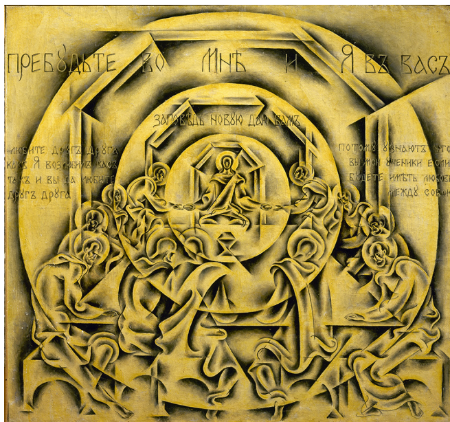
Ил. 3. С. В. Воинов. Тайная вечеря. 1918. Х., м.