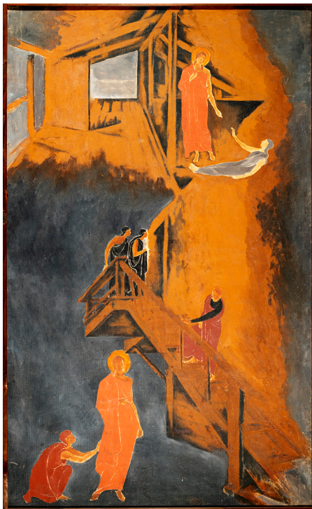
Ил. 7. С. В. Воинов. Чудеса исцеления о край одежды и воскрешения дочери Иаира. 1920. Х., м.

символизма (Эдвард-Берн-Джонс, «Золотая лестница», 1876–1880; Морис Дени, «Лестница в листве», 1892) и футуризма (Марсель Дюшан, «Обнажённая, спускающаяся по лестнице», 1912). Для модернизма, как и для средневекового искусства, характерен интерес к симультанному изображению в одной композиции разновременных и разнопространственных явлений.