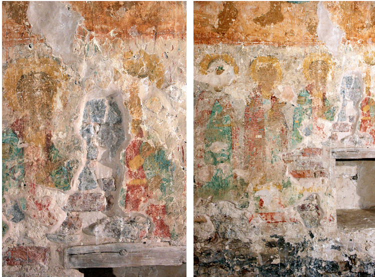
Ил. 10. Свв. Борис и Владимир. Фото: Г. П. Геров, 2023 (слева)