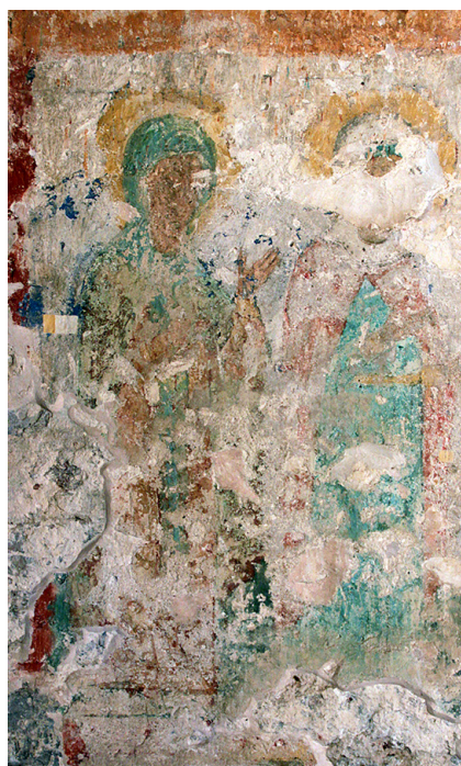
Ил. 14. Неизвестные святые жёны.