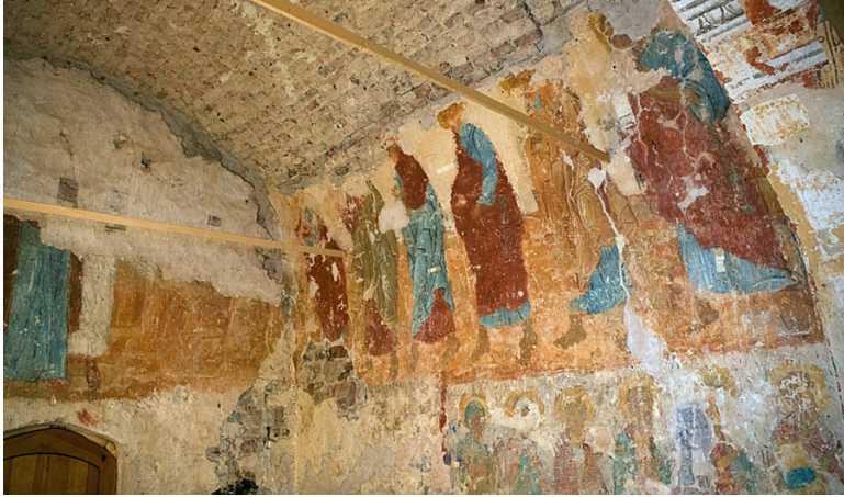
Ил. 6. Вознесение. Фрагмент композиции. Фото: Г. П. Геров, 2023