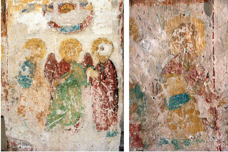
Ил. 8. Апостолы Пётр и Павел, благословляемые Христом в присутствии ангела.

Кто они? Надписей не сохранилось, единственную возможность идентификации дают некоторые иконографические особенности изображений.