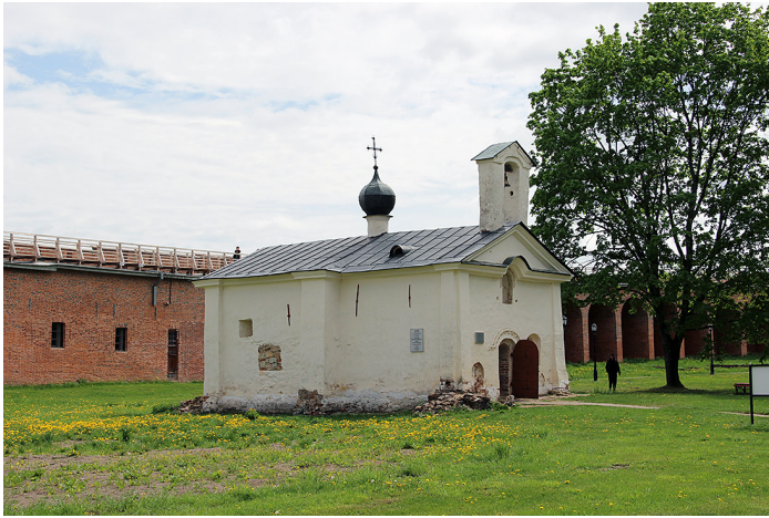
Ил. 1. Новгород. Церковь Андрея Стратилата. Вид с северо-запада. Фото: Г. П. Геров, 2023

раньше находился деревянный Софийский собор 3 . Через двадцать один год после его создания знатный новгородец Сотко Сытинич «заложил» вместо него большую каменную церковь 4 . Её строили шесть лет; «Горазда бо баше и лепа» – говорит о ней летопись под 6770 г. [ПСРЛ 2000 а, 311]. 14 октября 1173 (6681) г. «святи церковь <...> Илия архиепископъ новгородьскыи, святую мученику Борису и Глебу, камяную, въ граде» [ПСРЛ 2000 а, 34, 223].