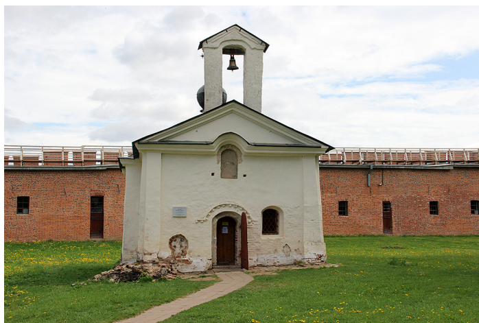
Ил. 4. Церковь Андрея Стратилата. Вид с запада. Фото: Г. П. Геров, 2023

Злоключения Борисоглебского храма, однако, на этом не закончились. В 1405 (6913) г. его уничтожил пожар [ПСРЛ 2000 а, 398; ПСРЛ 2000 б, 397; ПСРЛ 2000 г, 150; ПСРЛ 2004, 164], после чего только 36 лет спустя храм был восстановлен архиепископом Евфимием II на старой основе. Летописи добавляют (под 6949 г.): «и быша ему пособънници новгородцы» [ПСРЛ 2000 а, 421, 463; ПСРЛ 2000 б, 437; ПСРЛ 2000 г, 183; ПСРЛ 2004, 179]. С его южной стороны, на месте разобранный лестничной башни XII века, уже имелось другое, гораздо меньшего размера сооружение – церковь Андрея Стратилата. В конце XV столетия (7002 г.) Борисоглебский собор вновь «огорел» [ПСРЛ 2004, 212].