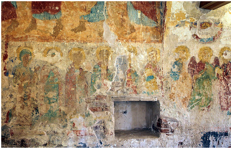
Ил. 7. Первоначальная роспись.

В самой восточной части композиции расположены изображения апостолов Петра и Павла, между которыми представлена фронтальная фигура архангела (Михаила?). За этой группой следуют шестеро святых. Первоапостолы предстоят в молитве Христу, чья фронтальная полуфигура с архиерейским благословляющим жестом (обеими руками) представлена над ними в сегменте неба (ил. 8). Изображённые левее персонажи воспринимаются как следующие за апостолами в молитвенном предстоянии, несмотря на то, что между Петром и следующим святым прочерчена вертикальная разгранка. Все они представлены в молитве в трёхчетвертном развороте к востоку, что отличает их от традиционных для нижнего регистра фронтальных изображений. Композиция смотрится не как часть такого фриза фигур, а как образ коллективного моления избранных святых.